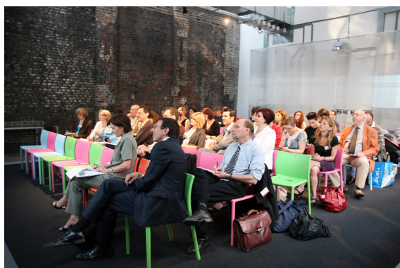
4 Congrès AMCSTI 2010 Mons