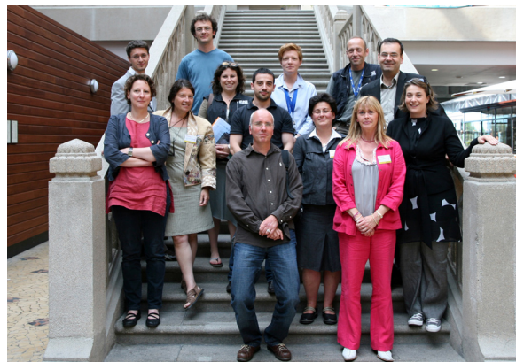
3 Congrès AMCSTI 2009 Cherbourg