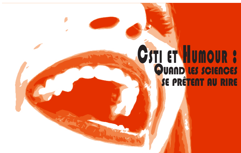
1 Affiche du congrès