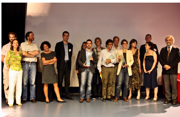
2 Cérémonie des Diderot. Congrès AMCSTI 2011 Strasbourg